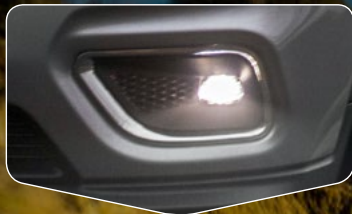
Lámparas de niebla