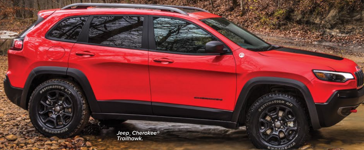
Jeep Cherokee® Trailhawk.