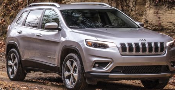
Jeep Cherokee® Limited.