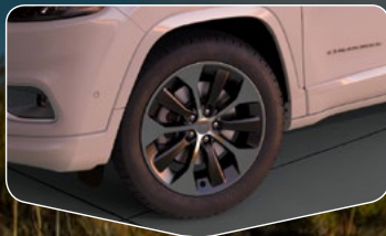
Rines de aluminio pulido de 19" versión Overland