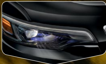
Lámparas de LED