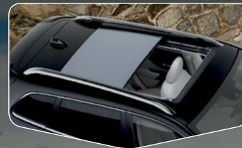
Quemacocos dual panorámico CommandView® y rieles cromados en toldo